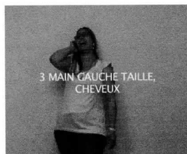
3 MAIN GAUCHE TAILLE, CHEVEUX