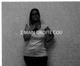
2 MAIN DROITE COU