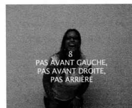
8 PAS AVANT GAUCHE, PAS AVANT DROITE, PAS ARRIERE