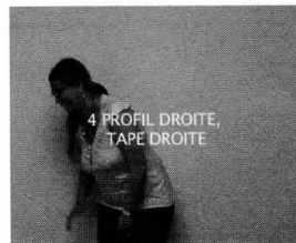
4 PROFIL DROITE, TAPE DROITE